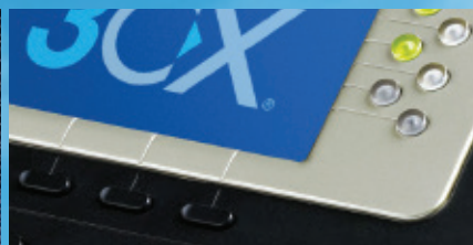
Komfortfunktionen – Keine Mehrkosten für Voicemail, Sprachdialogsystem und Warteschleifen.